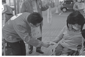
街頭募金運動の様子(10/1(火))

アイアイ鯖江 アルビスさばえ鳥羽店 アルプラザ平和堂鯖江店 うるしの里会館 えきライブラリートote エーコープ東さばえ店 Cafe & Lunch こころ 生協ハーツ神中 鯖江市社会福祉協議会鳥羽事業所 鯖江市役所 市民活動交流センター 市民ホールつつじ 神明苑 生協ハーツさばえ ダイナム福井鯖江店 中河地区文化祭 (有)ニシザワ紙文具 のだや餅店 ハニー東陽店 バロー神明店 バロー東鯖江店 ビックベリーマーケット北野店 文化の館 ユーカルのさばえ館 ラポールゼカわだ ワイプラザグルメ館東鯖江店 ワイプラザ鯖江店