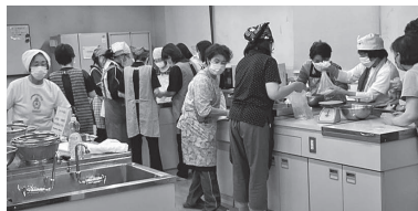
災害時に役立つ献立の調理実習