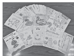
児童の皆さんが書いた心のこもった年賀状をお届けしました。

* 戸別募金…1世帯あたり100円を目安に市内全戸にお願いしました。 * 特別募金…この運動に賛同いただいた団体、個人で、寄付者は下記に記載。