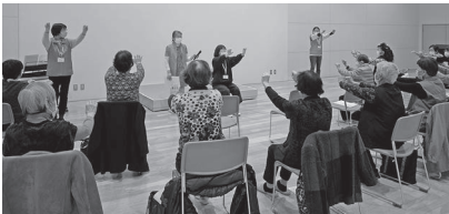
鯖江市内でサポーターが活躍しています