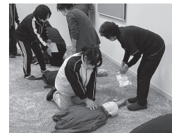
AEDを使用した救急救命講習