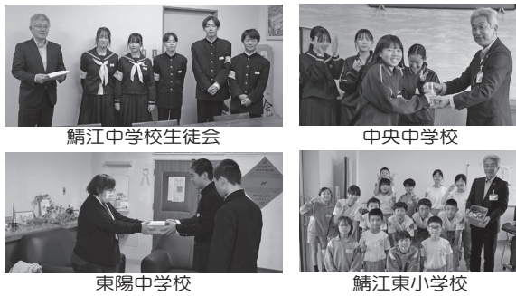
鯖江中学校生徒会

借陰小学校 JRC 鯖江東小学校 神明小学校 片上小学校 立待小学校 吉川小学校児童会 豊小 北中山小学校 鯖江中学校生徒会 中央中学校望文会 東陽中学校