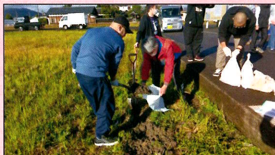
【熊田町防災訓練の様子】

二丁掛町…計画を提出したが、避難場所として問題があり再提出を求められ、対象者2名分の承認を得た。福祉委員は関わっていない。