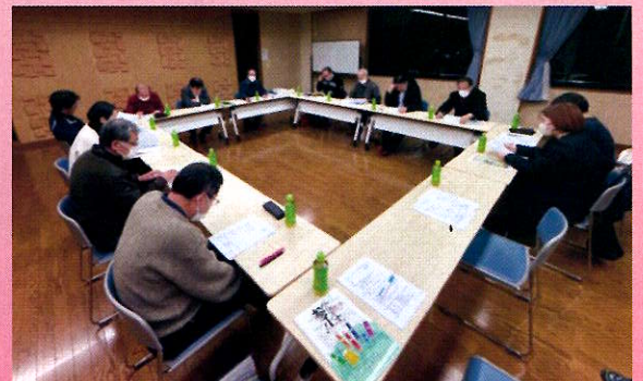
【計画推進委員会の様子】