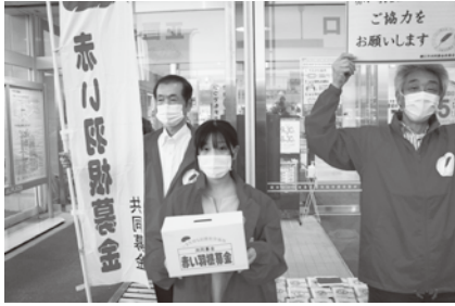
感染対策を行い街頭募金運動を実施しました。

ア イ ア イ 鯖 江 アル プ ラ ザ 平 和 堂 鯖 江 店 エ ー コ ー プ さ ば え 店 エ ー コ ー プ 東 さ ば え 店 ゲ ン キ ー 鯖 江 北 野 店 さ ば え N P O セ ン タ ー 鯖 江 市 役 所 市 民 ホ ー ル つ つ じ 市 民 シ ャ ル マ ン 神 明 苑 生 協 ハ ー ツ さ ば え 鳥 羽 事 業 所 な か ま 街 道 だ だ や 餅 店 の ニ ー 東 陽 店 ハ ニ ー み ゆ き 店 ハ ロ ー 神 明 店 バ ロ ー 東 鯖 江 店 バ ロ ー 東 鯖 江 店 ビ ッ ク ベ リ ー マ ー ケ ッ ト 北 野 店 文 化 の 館 ラ ポ ー ゼ か わ だ ワ イ プ ラ ザ グ ル メ 館 東 鯖 江 店