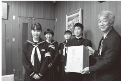
鯖江中学校生徒会

東 中央 陽 中 学 校 学 生 文 会 中 江 中 学 校 学 生 文 会 鯖 江 中 学 校 学 生 文 会 北 中 学 校 学 生 文 会 豊 小 学 校 学 生 文 会 吉 小 学 校 学 生 文 会 立 待 小 学 校 学 生 文 会 片 上 小 学 校 学 生 文 会 鳥 羽 小 学 校 学 生 文 会 神 明 小 学 校 学 生 文 会 鯖 江 東 小 学 校 学 生 文 会 進 徳 小 学 校 学 生 文 会 惜 陰 小 学 校 学 生 文 会