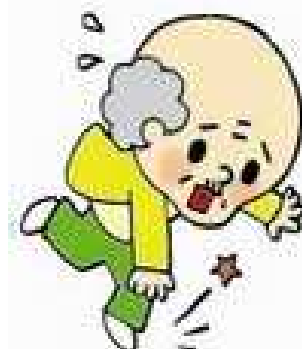
筋力低下・転倒予防