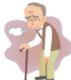
うつ・閉じこもり

これら一つひとつの症状は、初めは生活に支障をきたすことがなくても、いずれ寝たきりへの悪循環から介護が必要な状態へと移行していく危険性があります。